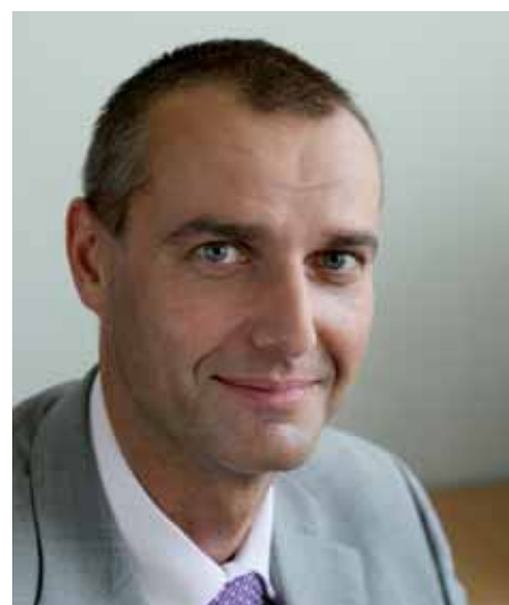
MUDr. Richard Raši, MPH, minister zdravotníctva SR

Aby sme vám pomohli pri hľadaní lacnejších alternatív liekov, ministerstvo zdravotníctva na svojej webovej stránke www.health.gov.sk/liekysetria pripravilo veľmi jednoduchú liekovú kalkulačku. Stačí poznať názov lieku, ktorý užívate, a kalkulačka vám ukáže okrem doplatku za liek aj všetky lacnejšie alternatívy. Zároveň sa môžete dozvedieť všetky dôležité informácie o danom lieku, od príbalového letáka, ceny, po jeho celú výrobu. Táto kalkulačka sa bude aktualizovať podľa súčasnej kategorizácie, čiže každé tri mesiace. Tá najbližšia nás čaká už v januári a ja som rád, že môžem všetkým opäť povedať dobrú správu. Znova sa zvýši počet liekov, za ktoré si priplatíte menej. Od nového roku budete mať k dispozícii 5 158 liekov, pričom viac než polovica z nich bude bez doplatku alebo s doplatkom do jedného eura. Pribudne aj viac ako 600 nových liekov. Aj pri nich bude možná zámena originálu za lacnejšie generikum. Nijako sa však nezmení vaša liečba